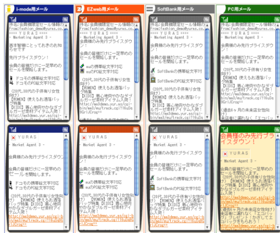
《マルチプレビュー画面》

デコメ、絵文字対応のため、受信者の興味を引くメールが作成できます。また、i-mode仕様で定義すると、他2キャリアおよびPC向けに自動変換し、テキストメールとHTMLメールのそれぞれ8つの画面を同時にプレビューできるため、運用の負荷を大幅に軽減できます。